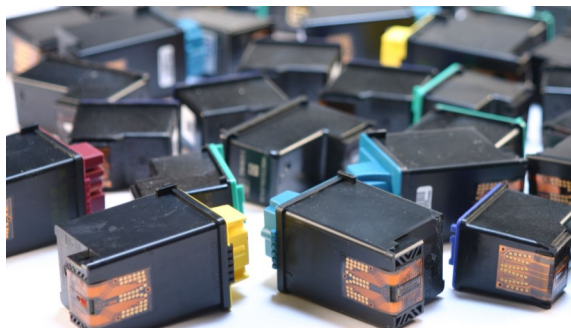
Cartuchos de impresora: láser o de inyección de tinta. Por favor, embótelos para que no goteen.

¿Preguntas? greenschool.jlespta@gmail.com