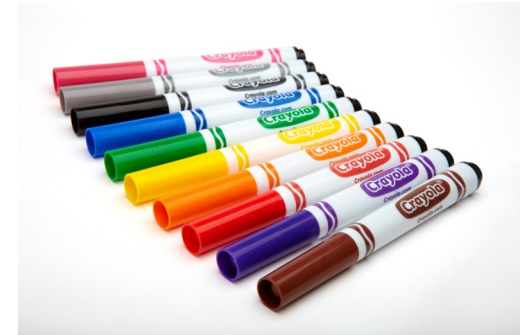
Rotuladores, rotuladores de borrado en seco y resaltadores