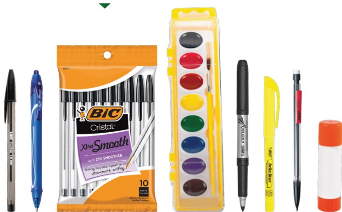
Bolígrafos vacíos, portaminas, bandejas de acuarela y barras de pegamento

El comité de Escuelas Verdes de JLES está recolectando los suministros que se enumeran a continuación para reciclar con nuestros socios Terracycle, Crayola Colorcycle y Evolve Recycling. Regrese en cualquier momento al porche de 14513 Omaha Court.